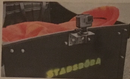
Lådcykeln är utrustad med en kamera som filmar resan.

Cykelturen filmas med en kamera som sitter längst fram på lådan, samtidigt spelar konstnären in samta-